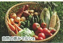
自然の恵みマルシェ