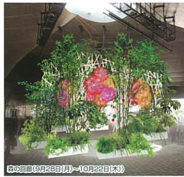
木の庭園(9月28日(月)～10月22日(木))