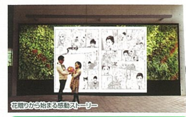
花贈りから始まる感動ストーリー

花贈りにまつわる感動エピソードを巨大漫画にて、壁面緑化とコラボレーションします。ラストの花贈りシーンの中で写真をとると、漫画の中で自分たちが花贈りしているかのように写る仕掛けに。2人だけの記念にさせていただくことができます。また、「花男子」による、来園者が主人公となる感動の花贈り企画を毎日開催します。