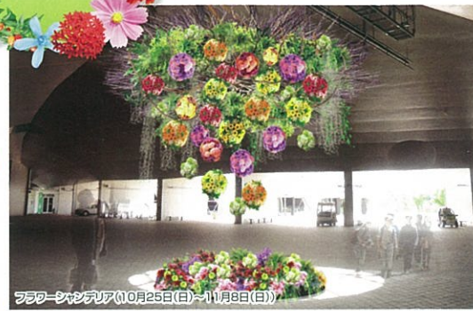
フラワーシャンデリア(10月25日(日)～11月8日(日))

地球市民交流センターを期間ごとに装飾します。最後の2週間は会場中央を生産量日本一の愛知のキクをボール状にアレンジした「フラワーシャンデリア」と「ミニガーデン」で飾ります。